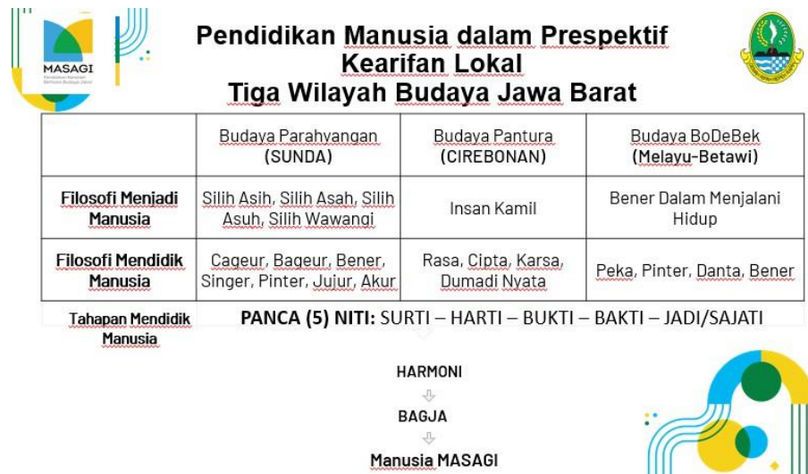
Gambar 1 Pembagian Sub-Budaya Jawa Barat dan Filosofi Masagi

Kurikulum Masagi merupakan kurikulum alternatif dan bukan menggantikan kurikulum nasional. Kurikulum Masagi adalah diversifikasi yang disesuaikan dengan budaya lokal Jawa Barat sehingga orang yang masagi selalu memiliki pemikiran yang konstruktif dan berpandangan menyeluruh, bijak dan visioner dalam menghasilkan keputusan (Dinas Pendidikan Jawa Barat, 2020). Implementasi kurikulum ini dibangun dengan kesadaran bahwa Jawa Barat terdiri dari tiga sub-budaya yaitu Budaya Parahyangan (Sunda), Budaya Pantura (Cirebonan), dan Budaya BoDeBek (Melayu-Betawi). Perbedaan dari ketiga budaya dari wilayah berbeda ini saling melengkapi masing-masing nilai lokalnya dan menjadi fondasi kuat karakter pembentukan manusia masagi dengan tahapan empat Niti dan dilengkapi satu Niti Sajati (utuh) sebagai bentuk akhir manusia Masagi .